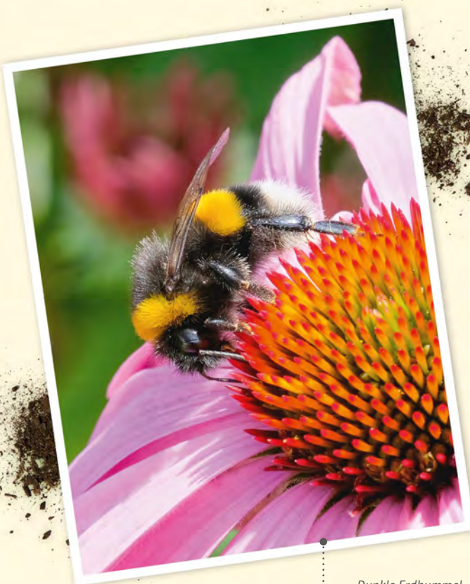
..... Dunkle Erdhummel